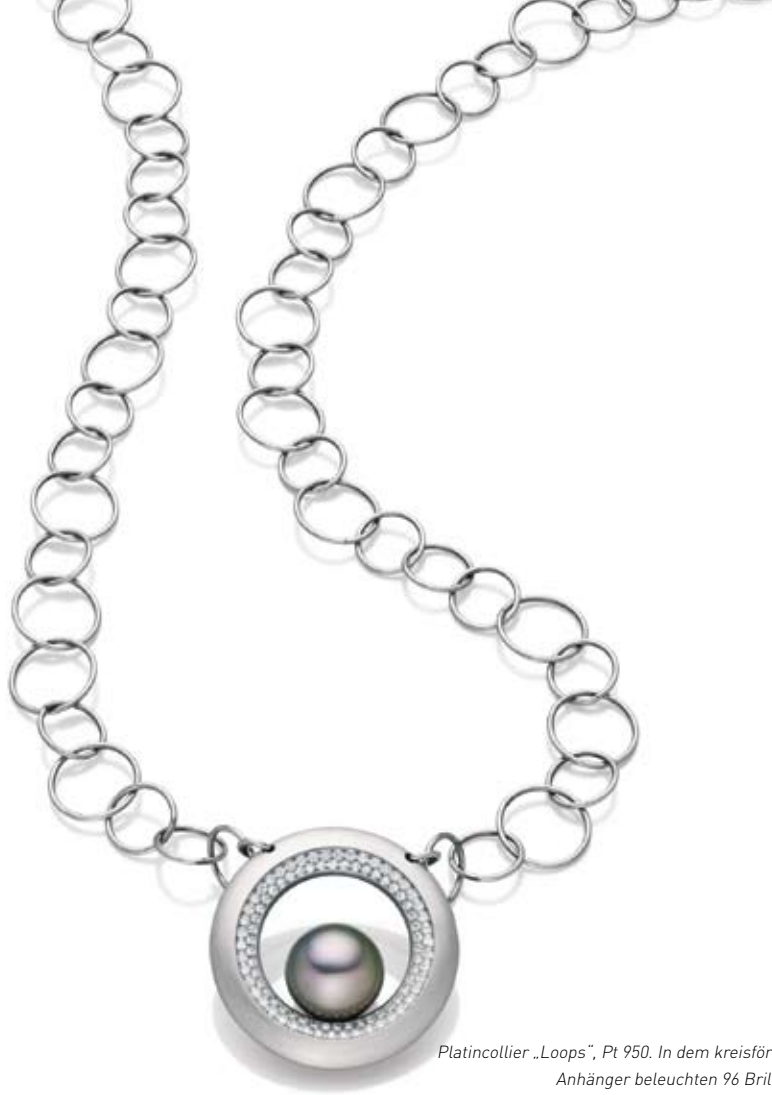
Platincollier „Loops“, Pt 950. In dem kreisförmigen Anhänger beleuchten 96 Brillanten eine scheinbar schwebende Tahiti-Perle. Platinkette handgefertigt. Jörg Kaiser, Bischweier.