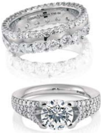
Platinmemoirering, Pt 950, mit 57 Diamanten im Brillantschliff (zus. 3,62 ct) und Platin-Solitaire, Pt 950, mit Pavéfassung, 60 Diamanten im Brillantschliff. Christian Bauer, Welzheim.