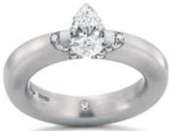
Für Extravagante: Platin-Spannring „Eder Tropfen“, Pt 950, mit Diamant im Tropfenschliff (1,01 ct) und 19 Brillanten (zus. 0,20 ct). Yuriy Gortikov, Dortmund.